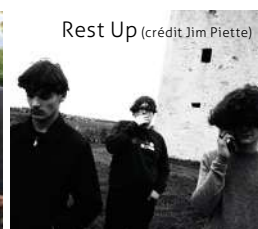
Rest Up (crédit Jim Piette)